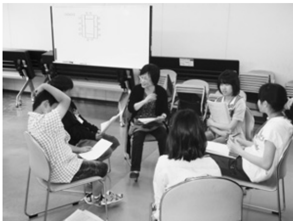
英語での会話も少しずつ上達