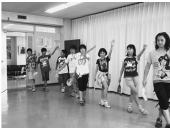
気持ちを一つにしてホタル音頭の練習