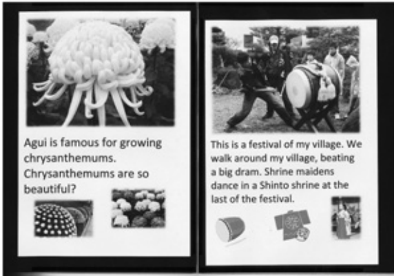
秘密アイテム「自己紹介アルバム」

町では、小中学生の国際理解・国際交流を目的に、小学校6年生を対象とした小学生海外派遣事業と海外交流先小学生受入事業と、中学校3年生を対象とした海外家庭生活体験事業を行っています。小学生はシンガポールのフェンシャン小学校との交流を、中学生はカナダへの派遣を行います。