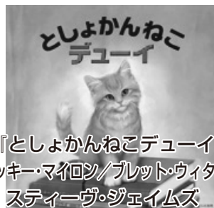
『としょかんねこデューイ』

アメリカの小さな図書館の返却ポ ストに捨てられていた子猫のお話。 助け出され、デューイと名づけられ た猫は図書館の人気者になった。