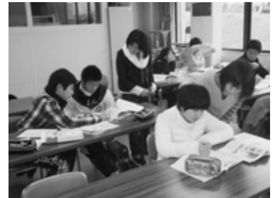
<朝食を食べて頭はフル回転>