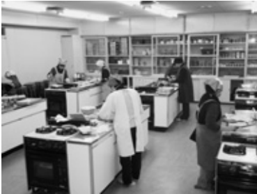
<心を込めて朝食を準備>

阿久比サタデースクール(A・S・S)は、中学生の生活習慣と学習習慣の定着を図るために毎週土曜日の午前8時30分～午前10時30分の2時間、阿久比スポーツ村クラブハウスで行う「中学生土曜朝塾」です。