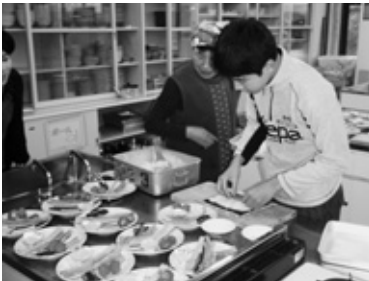
<巻きずし作りは食育の一環>

□問い合わせ先 学校教育課(サタデースクール担当) ☎(48)1111(内202)