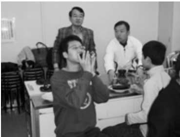
<願いが叶いますように>