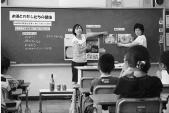
<飲酒の悪影響を学ぶ>