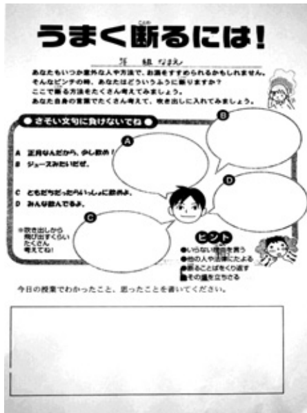
<「分かる」より「できる」が大切>

幼保小中一貫教育プロジェクトでは、心と体の健康を大切に、道徳や保健分野での授業を通して、生命尊重の心を育てていきたいと考えています。