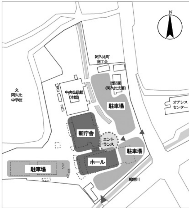
案②「南館跡地+町営プール跡地」