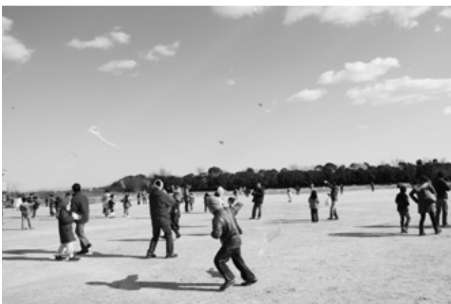
手作りのビニールカイトを揚げる参加者

各地区自慢の大凧の準備が整うと、周囲に緊張感が漂います。大凧が空へと上がっていくと、見守る人たちから歓声が上がりました。