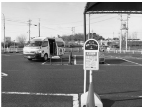
ピアゴに停車する循環バス（オレンジライン）

（先着順） 三月十八日（日）午前九時～ 正午・半田消防署成岩出張所・定員二十人（先着順） □申し込み・問い合わせ先