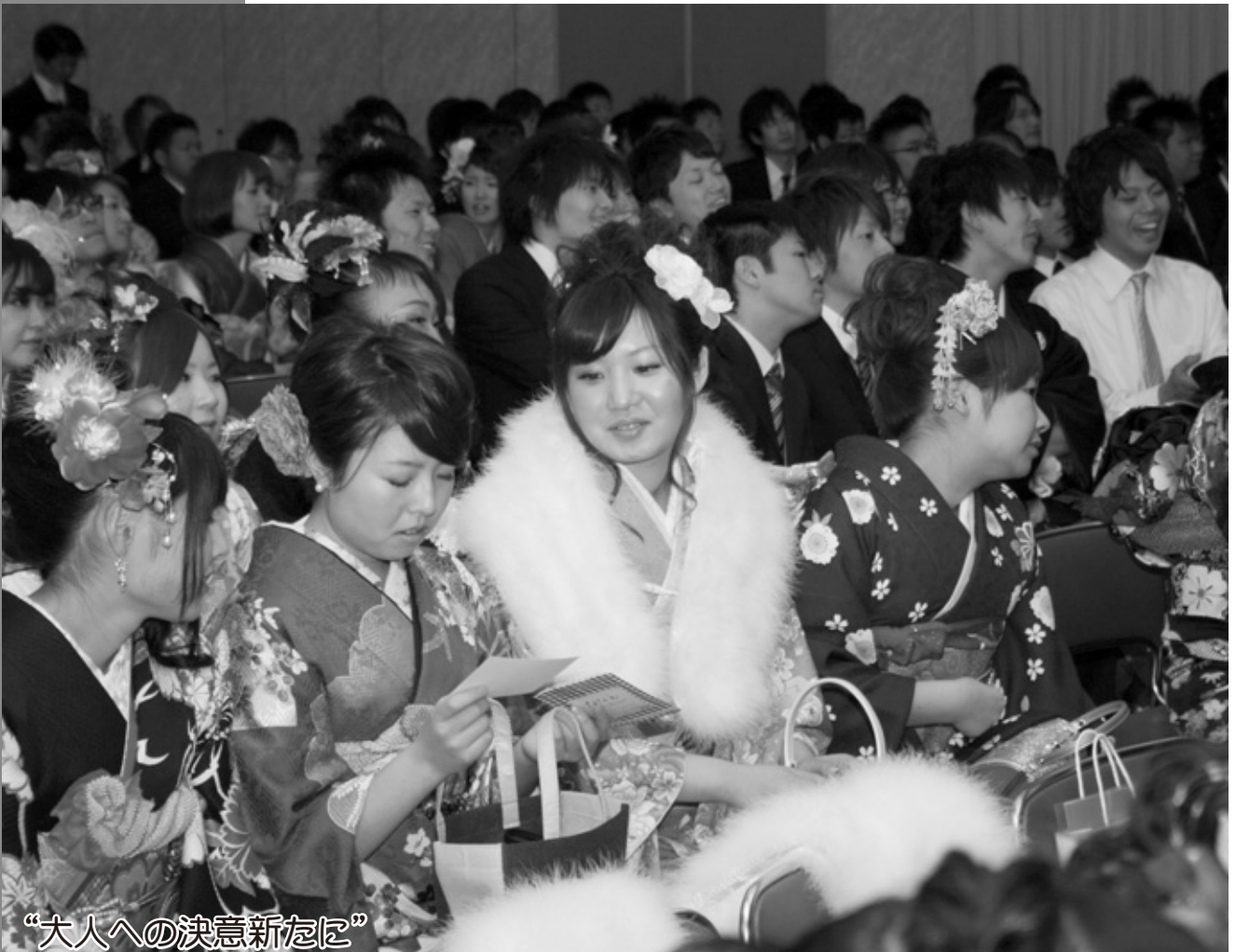
“大人への決意新たに”

「成人の日」の1月9日、勤労福祉センター（エスペランス丸山）で成人式が行われました。出席した新成人192人は、華やかな晴れ着やりりしいスーツ姿で、旧交を温めていました。