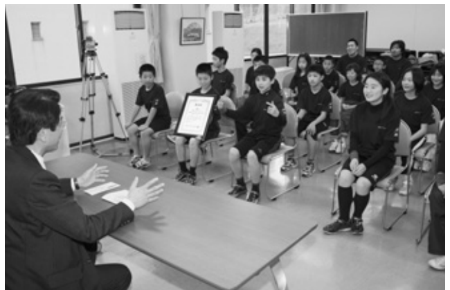
地区大会優勝を報告

ロープジャンプは、10人以上が一緒に跳ぶ大縄跳びです。跳んだ回数と人数を掛け合わせたポイントと、跳んでいる人がロープの外のメンバーと入れ替わったときのポイントの合計で競います。