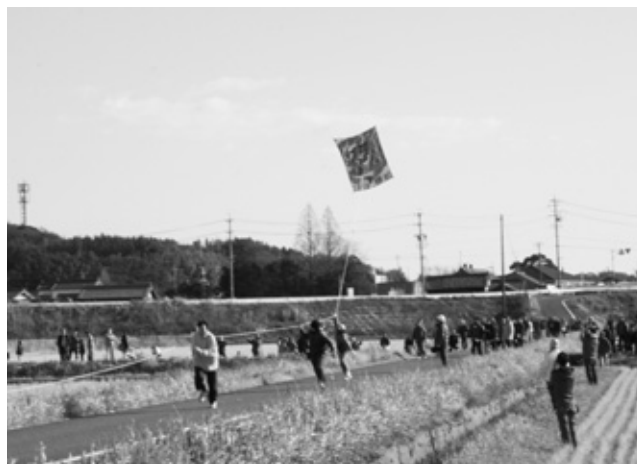
空へと舞い上がる大凧

子どもたちは、凧作り講習会で自ら作ったビニールカイトで凧揚げを楽しみました。思い思いの絵が描いてある個性豊かな凧が大空を舞いました。