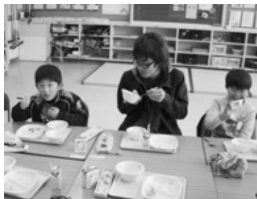
一緒に食事しながら給食指導

現在、地域に住む教員志望の大学生に、サポーターとして町内小中学校に入ってもらい、学習や生活の支援を行っています。学生たちは、授業中の個別支援、給食指導、校外学習での安全確保、行事の準備手伝いなど学校生活のあらゆる場面で子どもたちの支援をしてくれています。学生たちにとっても、学校現場を肌で感じるよい機会となっています。