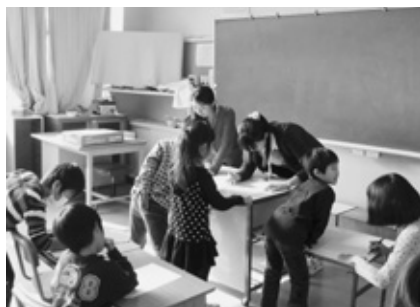
担任と一緒に丸付け

□問い合わせ先 学校教育課(学校支援地域本部事業担当) ☎(48)1111(内202)