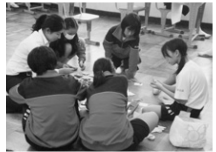
生徒とともに行事の準備