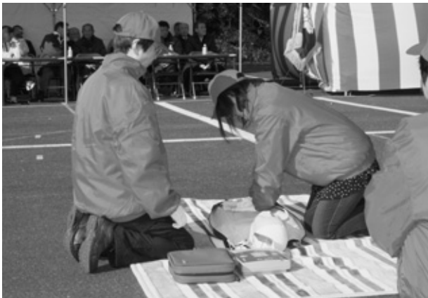
AEDを使った応急手当訓練

が参列しました。 式では町長が「総合的な地域防災 力を充実させる必要があります、自助・ 共助を實踐し、町全体が一段となっ て、災害における『想定外』を克服 する強いまちづくりを進めていきたく い」とあいさつ。続いて参加団体に よる力強い分列行進がありました。 赤十字奉仕団による自動体外式除細 動器（AED）を使った応急手当の 訓練や、少年消防クラブによる消火 器やホースを使用した消火訓練のほ か、幼稚園年長組園児による元気 いっぱい防火パレード、消防団に よる色鮮やかな一斉放水が、訪れた 多くの来賓などに披露されました。 また、消防功労者の表彰も行われ、 十八人の消防団員が精勤章などを受