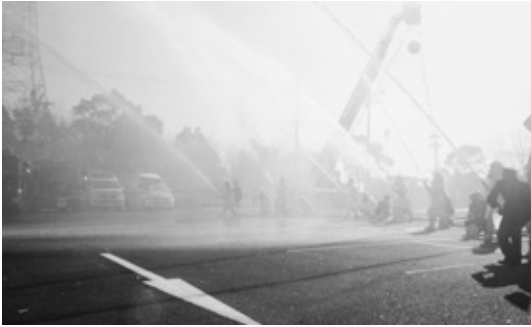
消防団による一斉放水

防災行政無線が聞き取りにくい場合は ☎(48)7030 で確認してください。最新の メッセージを聞くことができます。