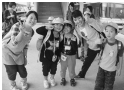
校外学習での安全確保