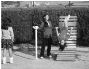
放課での遊び支援

町では、子育ては園・学校、家庭、地域が協働して進めていきたいと考えています。その取り組みとして、ボランティアの募集・調整・依頼などのコーディネート地域の方に参画していただきながら町全体で行う「学校支援地域本部事業」を進めています。これまでも保護者や地域の方の力を借りて、さまざまな形で学校支援ボランティアによる教育の充実を図ってきました。