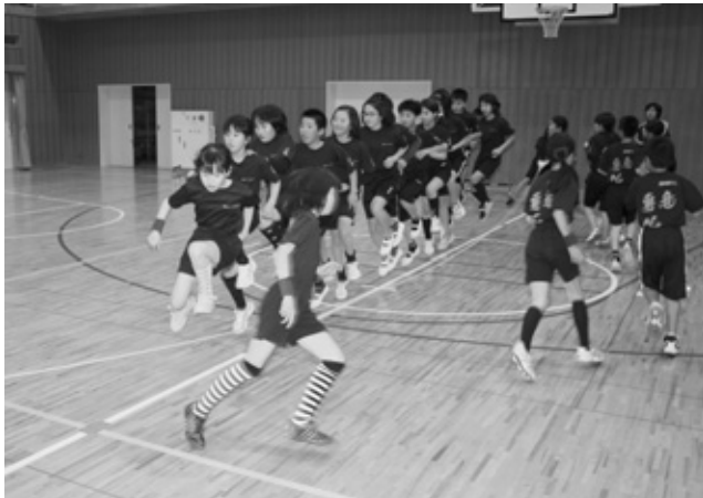
決勝大会に向けての練習風景

1月9日に愛知県武道館（名古屋市）で28チームが参加して行われた地区大会。英比ドリームフライツは、自己最高記録となる6,857ポイントの高得点を出し、旭北小学校（知多市）のチームとともに決勝大会（全国大会）進出の栄冠を勝ち取りました。