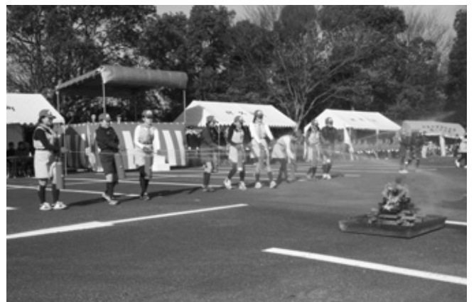
少年消防クラブの消火訓練