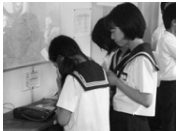
体験先に電話をする生徒

今年度は、8月1日～10日の期間に2年生249人が、町内を中心とした120の事業所や公共施設で行いました。キャリア教育の一環として、職場体験学習を「自分の生き方(進む道)や働く意味について考える機会」として取り組みました。