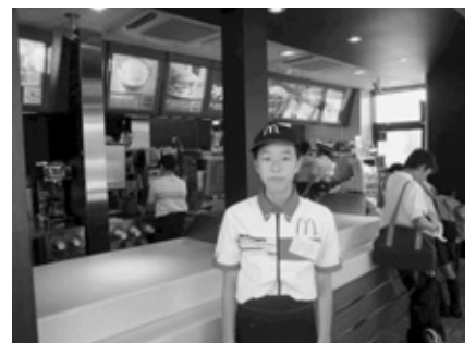
ハンバーガーショップ