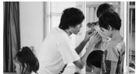
〈東部保育園での活動〉