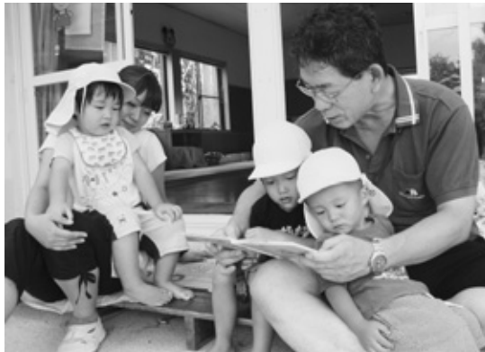
〈英保育園での活動〉

今年度も、幼稚園の教員や保育園の保育士が小学校で指導を体験する「小学校体験研修」（5月実施）、小中学校の教員が幼稚園・保育園で体験研修を行う「幼稚園保育園体験研修」（7～8月実施）が無事終了しました。