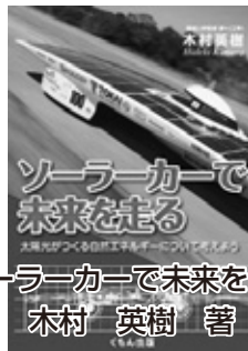
『ソーラーカーで未来を走る』 木村英樹 著

太陽の光をエネルギーに変えて走る車ーソーラーカー「東海チャレンジャー」が、オーストラリアを北から南へ走りきるのに使ったガソリンはゼロ。未来の社会で役立つ技術を紹介します。