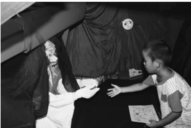
“きつねさん” からクッキーをもらう園児

英保育園で9月2日、お化け大会がありました。最初は年長児が挑戦。一人ずつお化け屋敷に入り、スタンプを押します。部屋の奥には招待した“きつねさん”が待っていて、合言葉をいうとクッキーを手渡してくれました。部屋に入る前は不安気だった子ども、無事部屋から出てくると安心した様子に。まだ部屋に入っていない子に「大丈夫だよ。怖くないよ」と励ましていました。