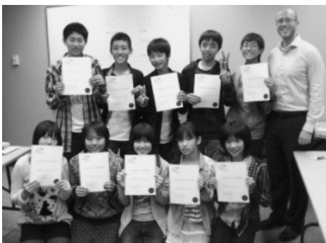
〈語学学校で修了証を受け取って〉

今回の体験事業の様子は、阿久比中学校のブログに、中学校の日々の様子とともにアップされています。阿久比中学校ホームページ ( http://blog.goo.ne.jp/aguichu/ ) 「日々の歩み(阿久比中ブログ)」の8月16日～8月25日の記事をご覧ください。携帯電話でQRコードを活用して見ることもできます。