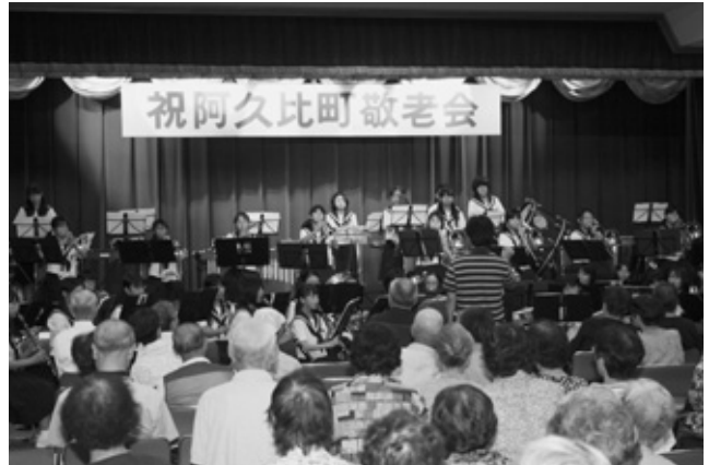
阿久比中学校吹奏楽部の演奏

町主催の敬老会が9月11日、勤労福祉センター（エスペランス丸山）で行われ、70歳以上の高齢者約300人が集まりました。