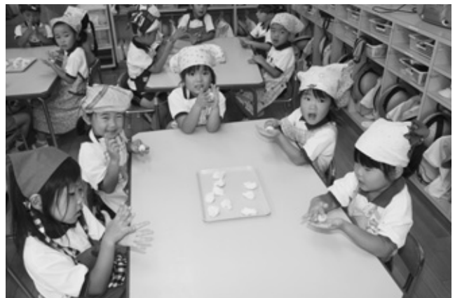
生地を丸める園児たち

中秋（旧暦8月15日）にあたる9月12日、ほくぶ幼稚園で月見団子作りがありました。