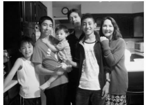
〈ホストファミリーと一緒に〉

この体験事業を通して、生徒は多くの人々の優しさに触れることができ、感謝の気持ちでいっぱいになりました。また、自分の気持ちを相手に伝えることの大切さ、思いが伝わったときの嬉しさを実感したようです。今後この10人が、国際感覚を磨き、英語力を高め、国際社会で活躍することを期待しています。