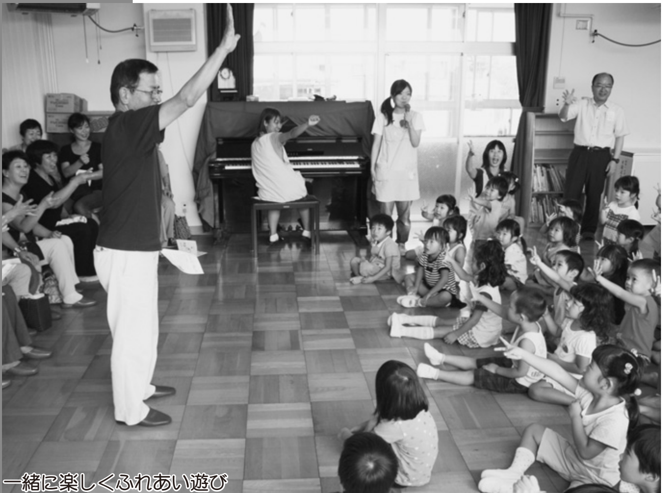
一緒に楽しくふれあい遊び

南部保育園で9月14日、園児の祖父母や地元老人会の方を招いて1日入園が行われました。おじいちゃん、おばあちゃんと子どもたちは、一緒に折り紙をしたり元気に歌ったりして楽しいひとときを過ごしました。