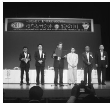
共同宣言を読み上げる紀の川市長

「第二十三回二〇一一 ほたるサミット in 紀の川」が六月十日に和歌山県紀の川市で開催され、阿久比町長らが参加してホタル保護の取り組みなどを紹介しました。 ほたるサミットは、ホタルを通じて自然に対する理解を深め、その保護に努めるとともに文化交流などの促進、生物多様性の保全、活力ある