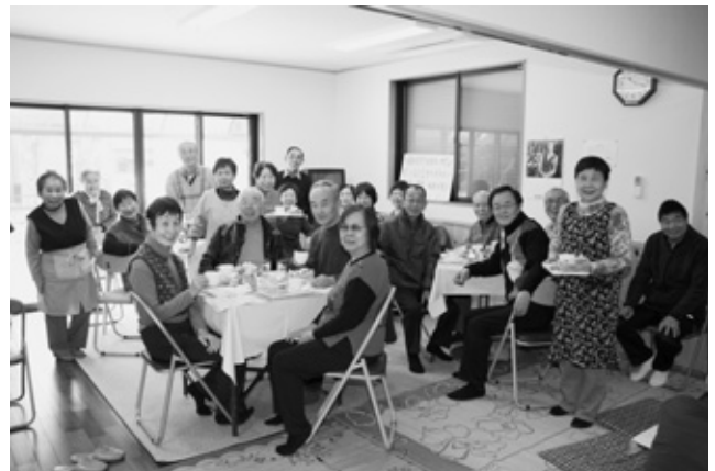
ふれあいサロンに集まる福住園高台地区の皆さん

福住園高台地区の高台友愛クラブ（同地区長寿会が母体で平成20年発足）が「ふれあいサロン」を立ち上げ、高齢者の皆さんがお茶を飲みながら、楽しく交流を図っています。