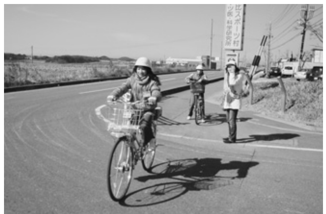
校外で自転車走行訓練を行う草木小学校6年生

2月16日、草木小学校で卒業前の6年生の児童を対象に自転車の交通安全教室を行いました。