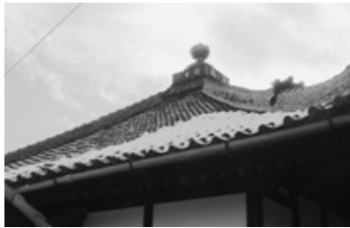
雪が残る観音寺の屋根

高岡地区の観音寺を訪ねた。前日降った雪が寺の屋根に残り、解け出した雪は軒の先端を伝わり、滴となって地面に落ちる。「うあ」。雪解け水が私の首筋を伝わる。思わぬ冷たさに自然と声が上がります。観音寺は知多四国八十八カ所霊場の十七番札所。現在の本堂は大正十三年から昭和元年まで三年かけて造られたもので、木造瓦葺方形造。方形造は「宝形造」とも書き、四つの