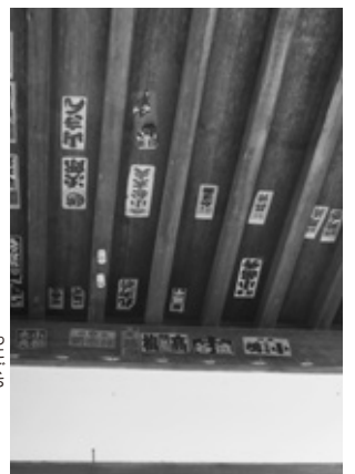
軒に張られた千社札

五十年に一度しか開帳しない本尊の「十一面観音菩薩」。欄間などに施される彫刻。元禄二（一六