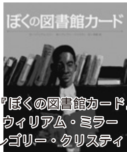
『ぼくの図書館カード』 ウィリアム・ミラー 文 グレゴリー・クリステイ 絵

1920年代のアメリカ南部。ぼくは、本が読みたいという気持ちでいっぱいだった。でも、黒人は図書館を利用することができない。黒人の子どもを主人公に、本を読む楽しさや図書館の魅力について描いた絵本。