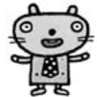
愛知県弁護士会新キャラクター 聞之助(きくのすけ)

弁護士が無料で相談にのります。借金の問題は解決できます。ひとりで抱え込まないでください。