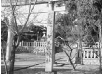
阿久比神社入口に立つ「社標」

新しいコースで石造物巡りの「ぶらり旅」を続ける。 阿久比神社の「阿久比神社社標」を見る。鳥居の手前に「郷社 延喜式内 阿久比神社」と大きな文字が記された、見上げるほど高い社標が立つ。 平安時代初期の宮中の記録が書かれている『延喜式』。その第九と第十の「神名帳」に記載されている神社を「式内社」と呼ぶ。