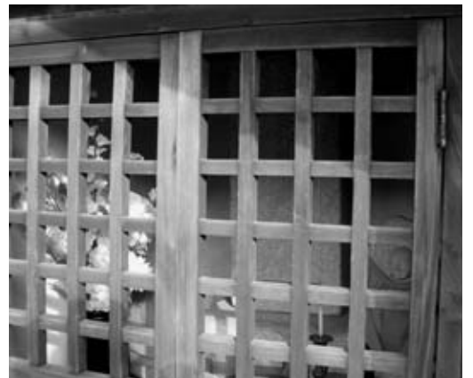
お堂の中にまつられる「六十六部供養塔」

お堂近くの民家を尋ねる。男性が「六部さんのことだね」と話を聞かせてくれた。 修行途中の六部が行き倒れてしまふ。疫病がはやり、村人がこの地で亡くなった六部の「供養塔」をまつり、願を掛けると不思議に疫病が終息したという。 「今で言うインフルエンザだろうね。医学に勝る先人たちの思いがなくなったということかなあ。春祭りには必ず「六部さん」の前で子どもたちが囃子の奉納もするし、阿久比地区では大切なものだよ。公会堂の近くには「行者さん」もいるし、帰りに見ていくといいよ。」 「地域で大切に守っていく。難しいことですけど、素晴らしいことですよねえ」。行者堂に手を合わせた後、目に映った、それぞれの民家から温もりが伝わってきた。