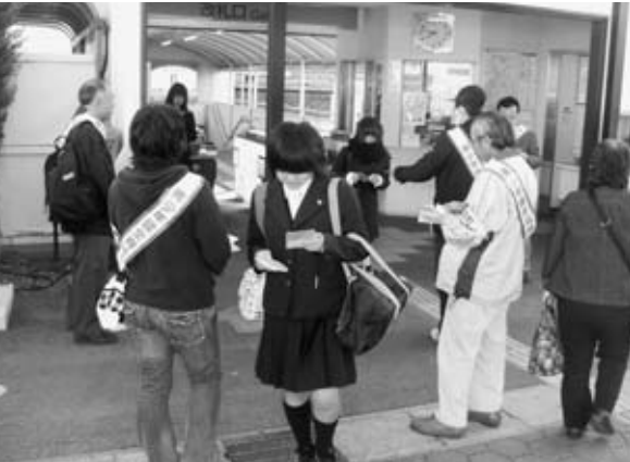
駅前街頭啓発を行う地区推進員の皆さん