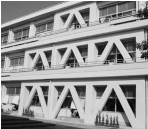
耐震補強工事を行った阿久比中学校校舎

平成二十年度の一般会計の歳入決算額は、六十八億八千八百十三万円で、前年度と比較し、一億二千五百七十五万円（一・九％）の増加となりました。これは、国庫支出金が一億四千九百十三万円の増、町債が一億二百七十万円の増などによるものです。 歳出決算額は、六十五億二千三十二万円で、前年度と比較し、二億五千二百三十九万円（四・〇％）の増加となりました。これは、東部小学校校舎耐震補強工事（一億二千五百七十九万円）阿久比中学校校舎耐震補強工事（一億八百十五万円）が主な要因です。