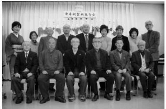
狂俳英比会のメンバー