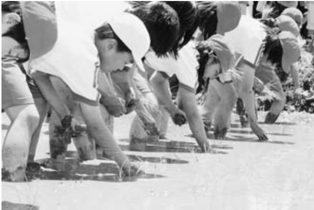
苗を植えていく草木小児童