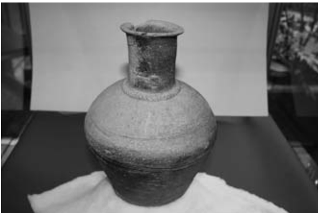
町指定文化財の長頸三筋壺

町教育委員会は宮津板山F古窯から出土した「長頸三筋壺」を町指定文化財（有形文化財）としました。