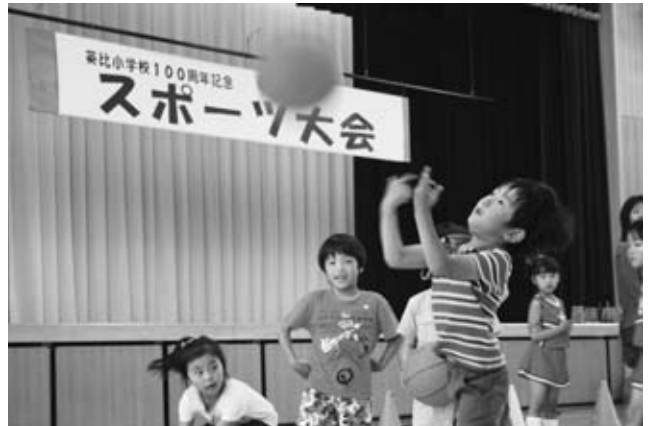
フリースローに挑戦する子どもたち

5月30日、英比小学校体育館で開校100周年記念行事の「スポーツ大会」が催されました。