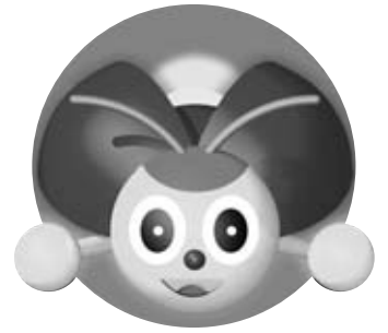
阿久比町 マスコットキャラクター アグッピー