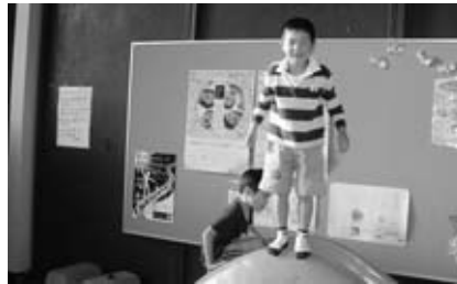
児童館で遊ぶ子ども

秋の日の午後、卯ノ山児童館周辺にぶらり出掛けた。役場から県道名古屋半田線を少し北に歩き、西に曲がり細い道に入ると、すぐに卯ノ山児童館が見える。児童館の敷地に入る前の掲示板で面白いものを発見。十月四日に開催される「ふれあいハイク」のポスターの中に私たち二人の姿がある。一年前の「ふれあいマップを歩く」シリーズで、ふれあいハイクに参加