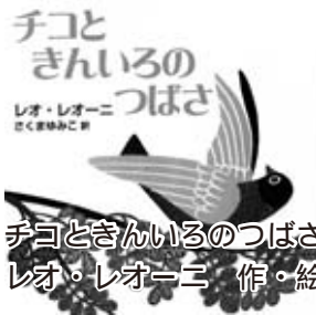
『チコときんいろのつばさ』 レオ・レオーニ 作・絵

仲間はみんな空を飛べるのに、チコには羽がない。しかしある日、黄金の羽を手に入れたチコ。大空を飛べるようになった時、仲間たちは...。「スイミー」でおなじみレオ・レオーニの知られざる名作。