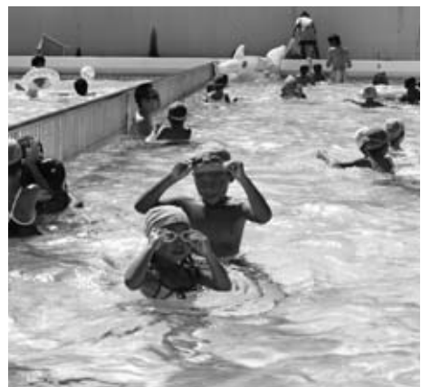
町営プールで元気に遊ぶ子どもたち

公民館では、かつて結婚披露宴も行われ、三組が宴を挙げた。三階大会議室にある大きな「びょうぶ」は、そのときの名残りでもある。新婚ホヤホヤでもある友人に「もう一度ここで披露宴やたらどう」と勧める。「今の幸せを、もう一度みんなに見てもらいたいです。冗談ですけどね...」。美人の奥さんをもらった男の言葉には自信と深みがある。