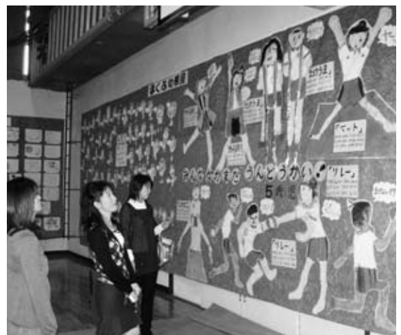
阿久比中学校体育館に展示された作品

阿久比町幼保小中一貫教育プロジェクトスタッフ一同 問い合わせ先 学校教育課 ☎(48)111(内202)