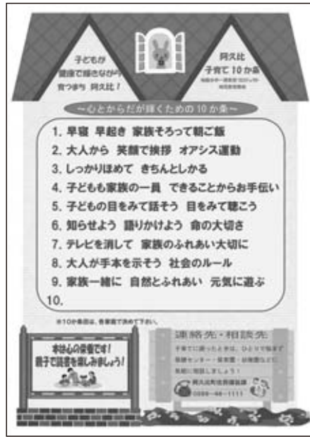
家庭に配布したパンフレット

「心とからだが輝くための10か条」と題して、幼児教育研究部会で9か条を定め、10か条目は各家庭で決めてくださいとお願いしました。園や学校から家庭に照会したところ、各家庭でそれぞれの「10か条目」が決められていました。その中からいくつかを紹介します。