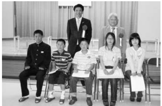
表彰を受けた優良児童生徒の皆さん