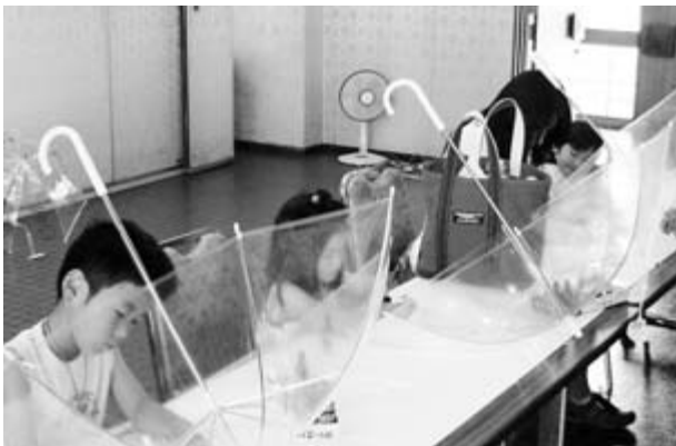
アートクラブコーナーで傘に「オリジナルアート」を描く子どもたち