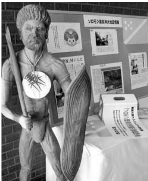
役場玄関前に設置した義援金箱

阿久比町では万博で築いた友好関係を継続するために、被災されたソロモン諸島国の方への義援金を集めています。