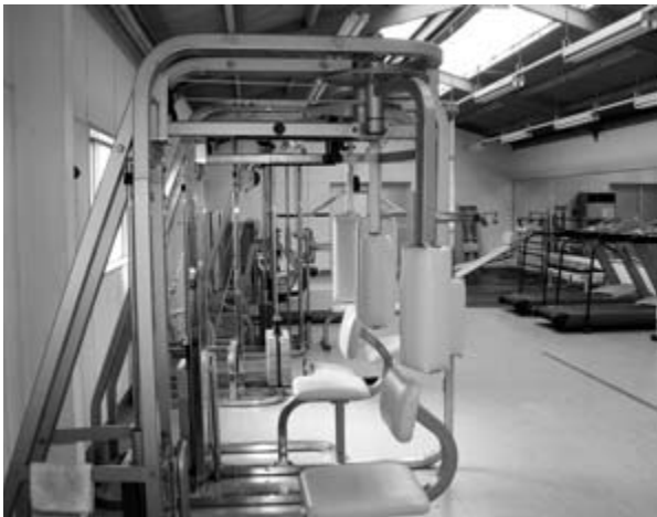
スポーツ村トレーニング室