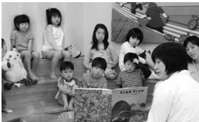
おはなし会で本の読み聞かせに聞き入る子どもたち

ゲームに夢中になる幼い子どもが増えています。子どもたちがゲームから受け取る感じは、何かを征服したという達成感の喜びではないでしょうか。 絵本や紙芝居には、多くの夢や希望が詰まった物語がいっぱいです。子どもたちはそんな絵本や紙芝居が大好きです。楽しい場面でのニコニコした笑顔。悲しい場面でのさみしいような顔。その顔の表情こそが本来の感性から生まれる、子どもたちの姿だと思います。 図書館では子どもたちの活字離れを防ぎ、読書の魅力を伝えようと、