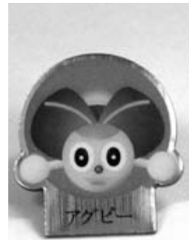
縦2cm・横1.5cmの ピンバッジ

町のマスコットキャラクター「アグビー」ピンバッジを作成しました。七月十日から三百個限定、一個三百円で販売します。