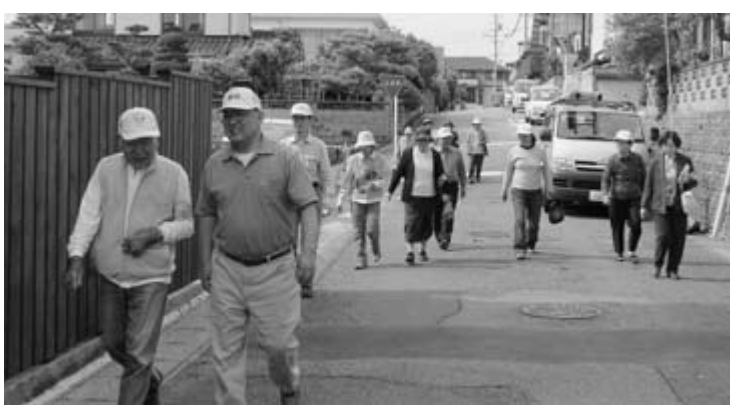
阿久比団地地区で防犯パトロールを行う長生会の皆さん