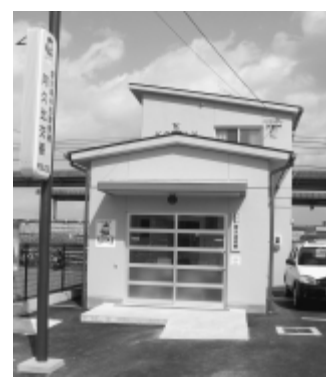
新築された阿久比交番