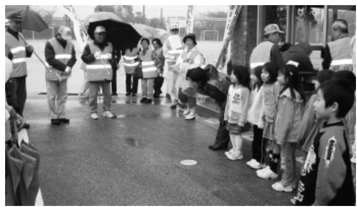
植地区防犯パトロール出発式(3月16日)で南部小学校児童に見送られるパトロール参加者

地域の安全に対する関心が高まり、住みよい地域社会を目指して連帯感のあるコミュニティ活動が広がっています。