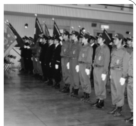
整列する消防団員

三月十二日、阿久比町消防団観閲式が中央公民館南館ホールで行われました。 町民の生命と財産を守る使命を持った消防団員のりりしい姿を来賓の前で披露しました。 また、次の皆さんが優良消防団員として表彰されました。(敬称略)