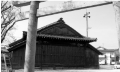
八幡神社の常舞台

今回は大古根村絵図を見ながらぶらり旅に出掛けた。 絵図を見ると、この村は東西に長く東の方は川に囲まれた形で田が広がり、その横に集落が見られるのでこの辺りを中心に歩くことにした。 まずは絵図にある蓮慶寺を目指す。きつい坂道を上りきった場所に寺は建つ。沿道から見える畑に、菜の花が色鮮やかに咲く。民家の花壇にはスイセンの花がちょうど見ごろを迎