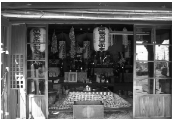
おばあさんたちの憩いの場「おやくさん」

いるらしいので行ってみることにする。 大古根地区で「おやくさん」と呼ばれる薬師堂の中で、おばあさんが二人こたつに入り、にこやかに会話をしていた。 声を掛けると外に出てきてくれた。「毎日ここに来て、おやくさんたちといっしょにいるのが日課ですよ」。 「歳も八十を超えました。元気で暮らせるのもここで遊ばせてもらっているおかげかな」と気さくに話しをしてくれた。 帰り際「これからも元気で長生きしてくださいね」と私たちが言うとう、「あなたたちも、お仕事ががんばってくださいね」と激励された。おばあさんたちは、私たちの姿が見えなくなるまで手を振ってくれていた。(おもわず胸が熱くなった。)