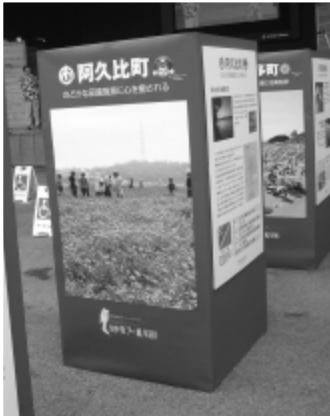
阿久比町を紹介するパネル