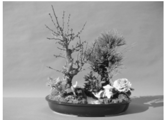
寄せ植え盆栽教室作品