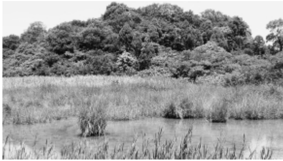
多くの生物が生息する湿地内の池