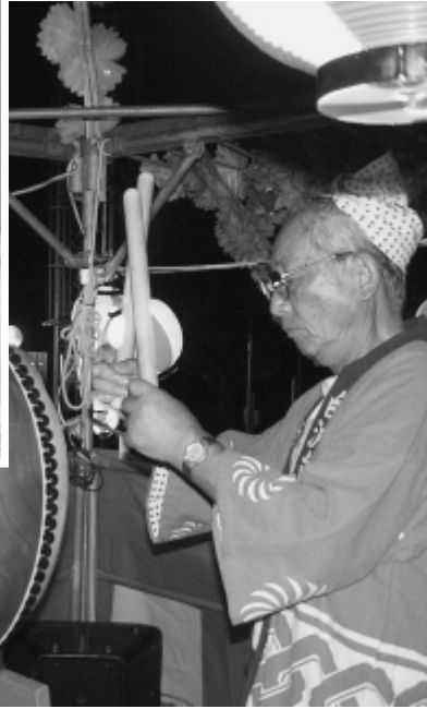
力強く打ち鳴らす太鼓