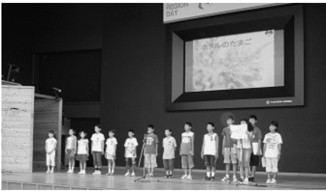
活動報告をする東部小学校児童