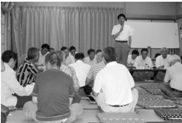
まちづくり懇談会が行われた宮津団地老人憩いの家の会場

7月下旬から8月中旬にかけて、町内の地区を9カ所の会場に分け、町長はじめ町幹部が出席して「まちづくり懇談会」を行いました。