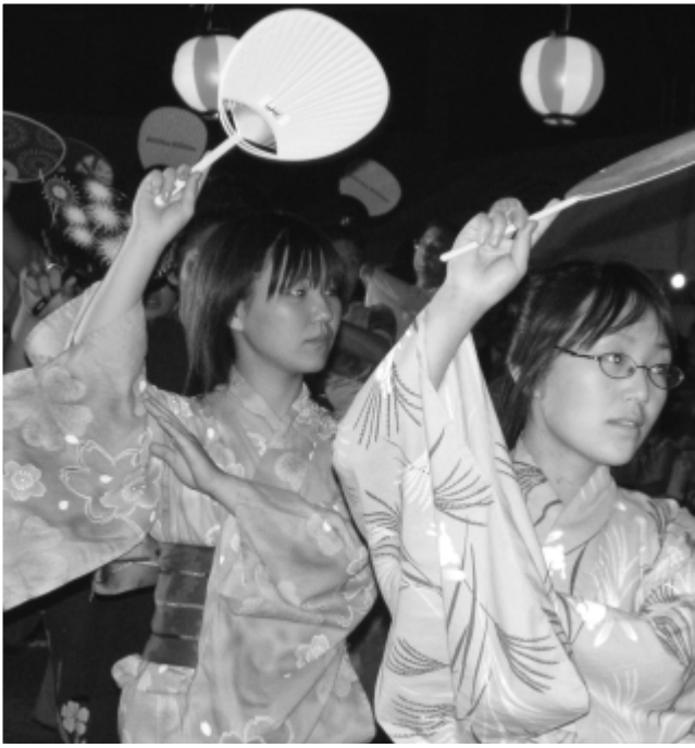
踊りを楽しむ皆さん