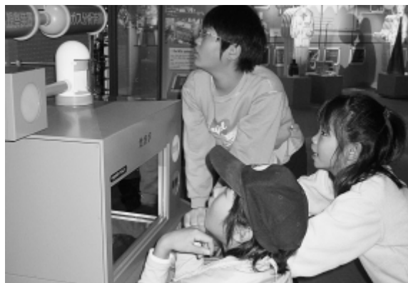
子どもチャレンジスクール(電気実験)