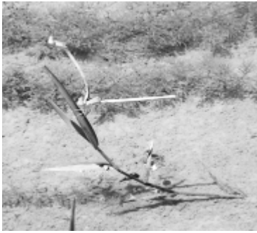
水辺を飛ぶトンボ