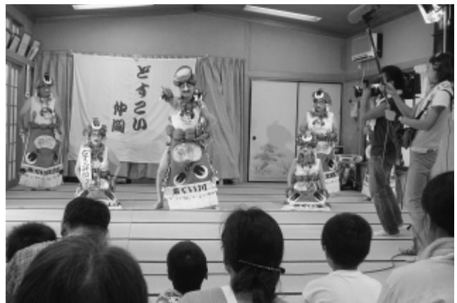
収録中の「どすこい仲間」のメンバー

8月10日、大阪読売テレビが阿久比町ボランティアセンター登録グループ「どすこい仲間」を取材に宮津団地老人憩いの家を訪れました。