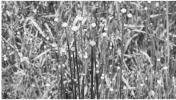
シラタマホシクサ

八月八日、親子ふれあい教室自然観察会に同行し、板山地区の高根湿地を訪れた。 湿地内の前方には森が広がり、中央には池が見える。保護されている場所に一歩足を踏み入れると、もうそこには貴重な植物が生育している。足で踏みつけられないように恐る恐るへつぴり腰で、前かがみになって歩を進める。 食虫植物のモウセンゴケを発見。海に生息するヒトデみたいでモゾモゾと動き出しそうな感じだ。そつと人差し指を近づけてみる。全く反応なし。少し離れた所にシラタマホシクサが咲き始めている。 湿地内には人工の池ではなく自然が作り出した池がある。周りには堤防がなく背丈五十センチ程の植物に囲まれている。中央付近からは孤島が浮かんでいるかのように植物が水の中から伸びている。水面に前方の森が映し出され、観光地の絵葉書に登場しそうな素晴らしい景観だ。 気合十分で長靴を履いてきたので