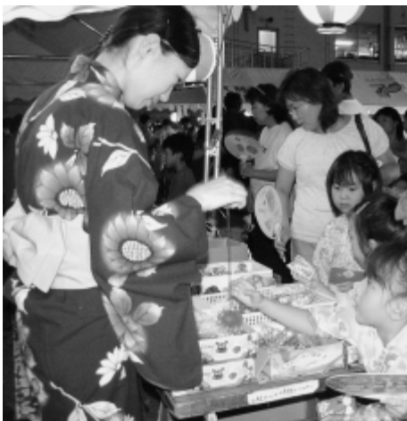
親子連れでにぎわう夜店

八月十六日、役場前駐車場であぐいふれあい盆踊りの夕べが盛大に行われました。 浴衣を着た老若男女が盆踊りの輪に加わり、阿久比音頭やオアシス音頭の曲に合わせて気持ちよさそうに踊っていました。 盆踊りのほかに、アトラクションでよさこいチームあぐい騰のメンバーが「よさこい踊り」の力強いダンスを披露してイベントを盛り上げました。 会場には金魚すくいコーナーなどの無料模擬店や夜店が設けられ、親子連れなどでにぎわっていました。