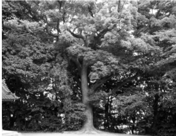
神明社のクスノキ