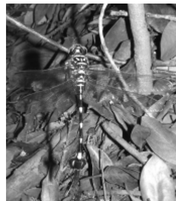
偶然発見したウチワヤンマ

ら飛んでいる。境内に到着。社の横にごんぎつねの石造があり、背後には雑木林が広がっていた。探検することにした。 一歩足を踏み入れると、樹海のような薄暗い世界が広がり、クモの巣だらけ。突然「ガサガサ」という物音。まさか「ごんぎつね」と思いつるを振り返ると大きなトカゲが足早に逃げていった。なんだか怖くなってきたので、太陽の光が当たる場所に戻った。 ちようど田植えが終わった水田を眺めながら、榎現山を背にして西狐谷池に向かった。 池の周りには、あぶない「阿久比町」の立て看板があるので、池には近づかないようにして、堤防沿いを歩いた。道端に咲く花にひらひらとチョウチョが舞っていた。遠目に池の中を見ると、魚だろうか、何かが飛び跳ね池の水面に何重もの輪が広がっている。その横をアメンボウが気持ちよさそうにスイスイ通り過ぎていった。 次回は箭比神社を散策します。