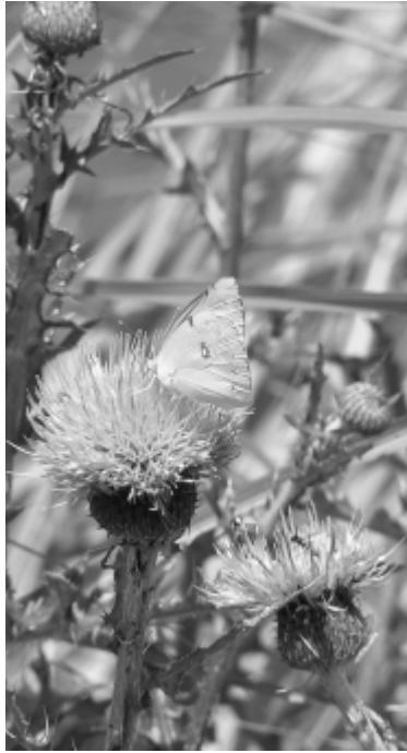
西狐谷池堤防に咲く花とチョウチョ