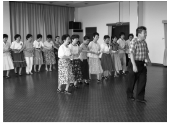
楽しいフォークダンス教室