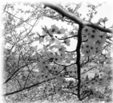
植公園から眺める桜