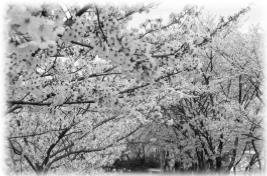
阿久比中学校“桜坂”