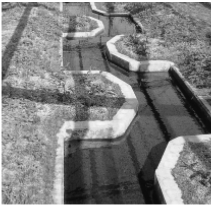
幼虫の放流を待つ人工川

現在幼虫は、約三千匹以上いますが、ここまで生育するためには、餌（タニシの切身）やりと水替えが大変でした。特に、ふ化した七月から、三丁四齡の幼虫に成長す