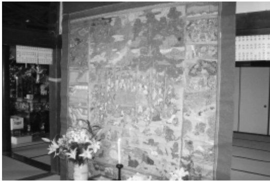
毎年3月16日に行われる“おせんぼ”で飾られる