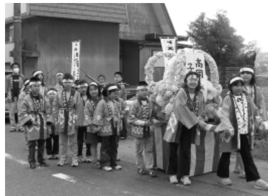
子どもみこし練り歩き