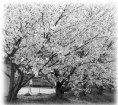
草木字池末付近の桜並木