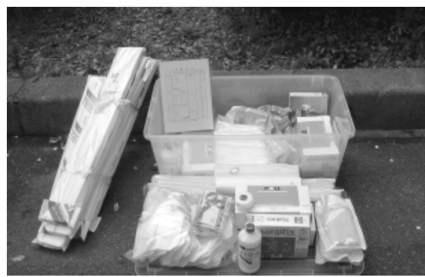
常備している外傷セット

倉庫に「外傷セット」を用意しました。これは、避難所である小学校で、軽傷などの手当を地域の皆さんに協力してもらうためです。日ごろから、皆さんが応急手当の方法を習得し、いざとなった時に活用できる知識が必要です。応急手当・心肺蘇生法の講習は、半田消防署阿久比支署で随時受け付けをしています。