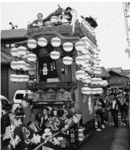
大古根八幡社山車