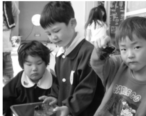
クワガタムシと遊ぶ草木保育園児