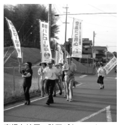
高根台地区の防犯パトロール

(活動地区) 宮津山田・高根台・草木・高岡・卯之山・阿久比・植・福住 (活動日) 毎月第一・二金曜日を中心に活動