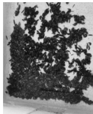
500匹以上いる幼虫飼育箱

る十月ころまでは、ほぼ毎日の餌やり（タニシ三十個くらい）と水換えが必要です。中でも、餌にするタニシの確保が困難で、多くの田や小川を探しても採取できないこともあります。（情報をお寄せください。）