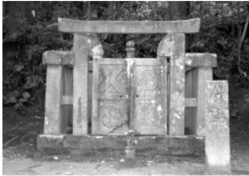
「於大の方」の遺髪が分納されている墓所 (この地は、久松・松平家葬地として町指定文化財となっている。)