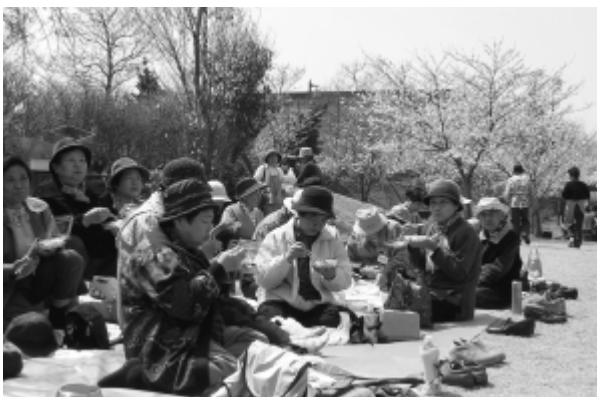
花見を楽しむ南部宅老所の皆さん