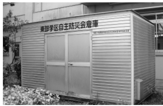
4小学校に設置してある自主防災会倉庫