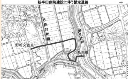
新半田病院建設に伴う暫定道路 半田市議会から提供のあった計画図

問 旧ごみ袋と新ごみ袋の切替えについて、周知されずに旧ごみ袋で出された場合の対応。 答 令和3年4月1日以降に旧ごみ袋で、ごみが出された場合は、警告シールを貼って残しておく予定。