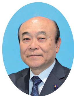
阿久比町議会議長