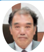
竹内 強 議員