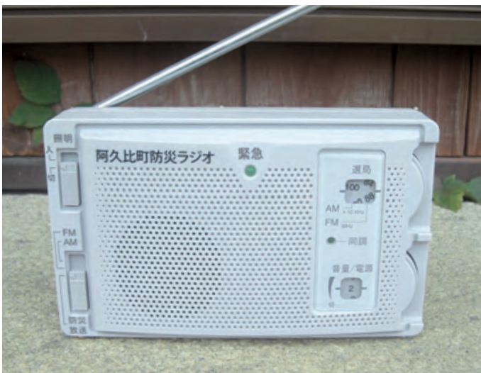
災害時の防災ラジオ

問 白沢地区の特別警戒地区に防災行政無線の設置ができるか。 答 「あんしん防災ねっと・テレビ・ラジオ放送」などあらゆるアンテナを持つことが必要。支障があれば、屋外拡声器で対応する。子局の増設は難しい。