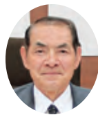
新美 敏弌 議員