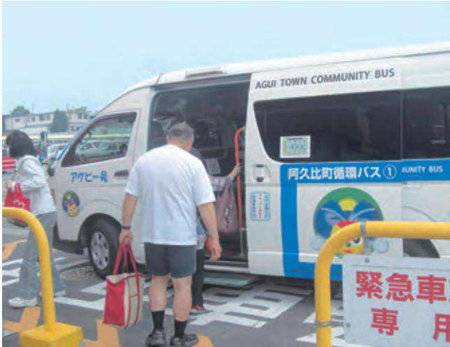
循環バスの利用風景（アピタ停留所）

問 白沢区内のスーパーから巽ヶ丘へのルートで知多市内の通行が可能か。 答 運行条件を整えば、不可能ではないが、その場合は、運行ルートの見直しが必要。