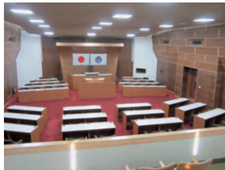
④傍聴席からの眺めです。