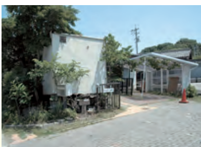
第2げんきッズ東部