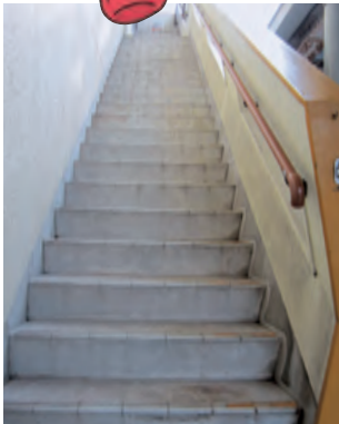
②西側の出入り口の左手の階段を上ります。

新庁舎完成に伴い、現在の議場で本会議を行うのは、年内に行う2回の定例会（9月と12月）となります。残り少ない機会です。ぜひ傍聴にお越しください!!お待ちしております。