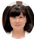
都築 清子 議員