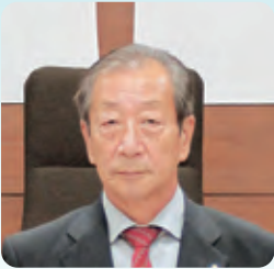
山本 和俊 議員