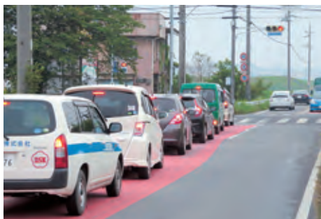
混雑する野崎交差点

答 都市計画道路環状線の整備は、愛知県の施行事業であり、現在、名鉄河和線や県道阿久比半田線との交差方法について、愛知県において検討中である。 今後県に早期着手を要望する。