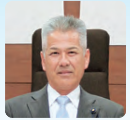
山本 恭久 議員

問 町道を取り巻く環境の変化により、利用者の安全が損なわれている実態を鑑み、その安全対策を最優先とした道路整備と利便性の確保に向けた抜本的な解決策を見出すためのスタンスを確認する。