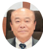
沢田 栄治 議員