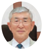
三留 享 議員