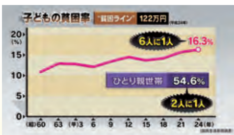
厚生労働省「国民生活基礎調査」を基にしたグラフ

答 生活困窮者自立支援による自立相談支援事業などを県と連携して行う。ひとり親家庭が必要とする保育に配慮し学童保育の対応を早急に検討する。