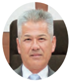
山本 恭久 議員