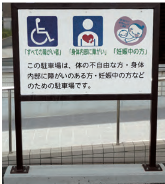
公共施設の駐車場に設置してある例 (常滑市役所)