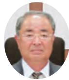
渡辺 功 議員