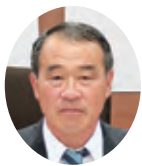
新美 正治 議員