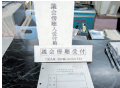
①総務課で受け付けをします。