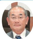
副議長 都築 重信