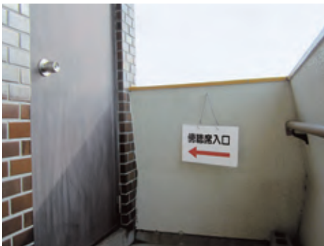
③左手の扉を開けてお入りください。