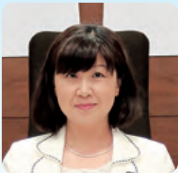
都築 清子 議員