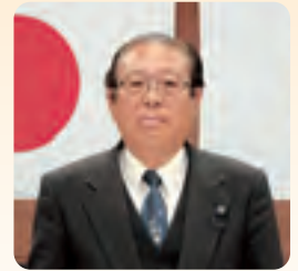
辻 忠男 議員

介護・医療総合法が6月の国会で成立し、平成29年度から実施される。この法改定は介護の社会化を目指して発足した制度が、財源難を理由に大幅に後退するものである。